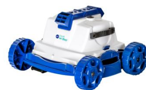
Robot Robot RKJ14