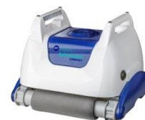
Robot Robot RKA80C