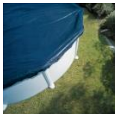
Cubierta de invierno Winter cover CIPROV821