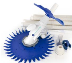
Limpiafondos automático Automatic cleaner 19007