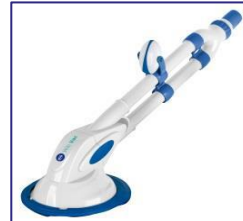
90399 Automatischer Reiniger Automatic cleaner