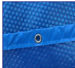
CV790205 Isothermabdeckung Isothermic cover