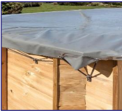
CI790205 Winterabdeckung Winter cover