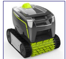
GT3220 Roboter Robots